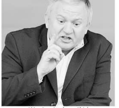
Obișnuit mai mult cu trifoiul, Porumboiu n-a știut să joace cu caro

Este echipa cu cele mai multe goluri înscrise din afara careului.