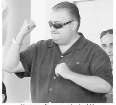
Un patron din tagma, celor (mulți!) care nu pricep, dar au mușchi!

Au început cu un egal timișoreniile acestă ediție de campionat și tot în egaluri au tinut-o. Asta nu i-a împiedicat să ajungă pe locul doi la finalul turului, pentru că, la o așezare cât de cât corectă a echipei în teren, mai ales cu Contra, pe a doua respirație, echipa a mai și câștigat. De altfel, o știe toată lumea, mai puțin lăncu, FC Timișoara e singura grupare fără înfrângere după 18 partide campionat. O echipă, altfel, solidă, ce are, de acum, destui internaționali. Iar