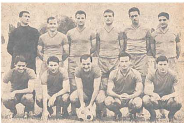
Una dintre frumoasele echipe din anii '60 ale grupării din Ștefan cel Mare

final al Campionatului Mondial de fotbal din Elveția din 1954, care a pierdut finala cu RFG cu 2-3, după ce conduseseră, în debut de partidă, cu 2-0 (în grupă spulberându-i cu 8-3), are rezonanță de scenariu antic. La