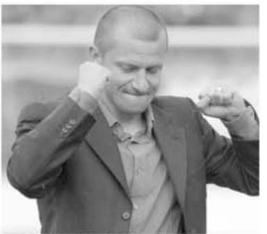
Eins, Zwei, Drei?! Nu, Dorinel nu concepe altceva decât... platoul de campion!

Stabilitate - așa scrie pe Oțelul. Cu jucători veniți, mare parte din ei, din propria pepinieră, cu un antrenor care mai are de luat ceva bani de la Steaua, cu un stadion fără