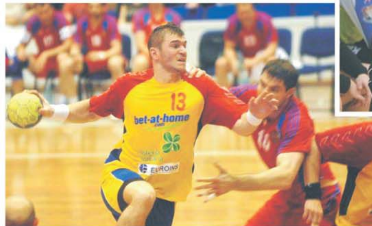
Joacă? Nu joacă? Aruncă? Nu aruncă? E vorba de Șania! Răspunsul la aceste întrebări, mâine, la conferința de presă dinaintea plecării spre Campionatele Mondiale din Suedia.