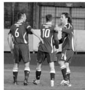
Jucătorii lui Alloa se felicita după victoria obținută cu 3-0, în partida cu Elgin