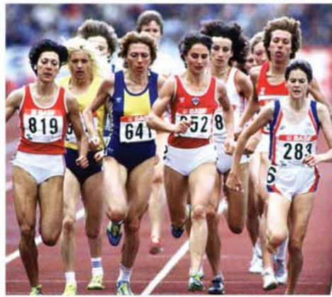
Doina Melinte, la Los Angeles, în cursa de 800 m. pentru aurul olimpic

federației, contribuim la pregătirea sportivilor pentru JO. Sincer, deși sunt bani puțini, familia sportului românesc a avut performanțe de-a lungul acestui an. Dacă am dificultăți, din funcția pe care o am? E o funcție destul de grea, dar am