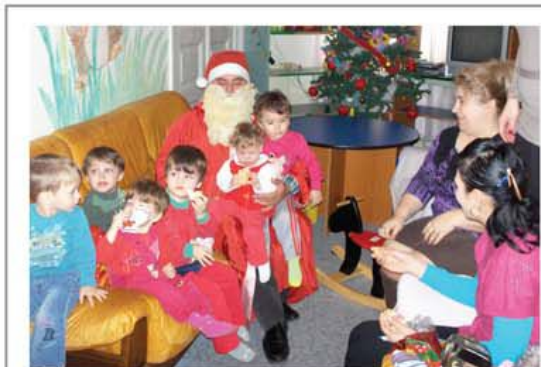
Copilași bucuroși de venirea Moșului