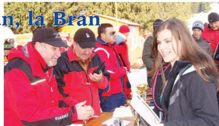
Înghesuiala de la masa de premiere este firească. Toți au câștigat...

Director Centrul de Profit Brașov al C.N. Loteria Română S.A.