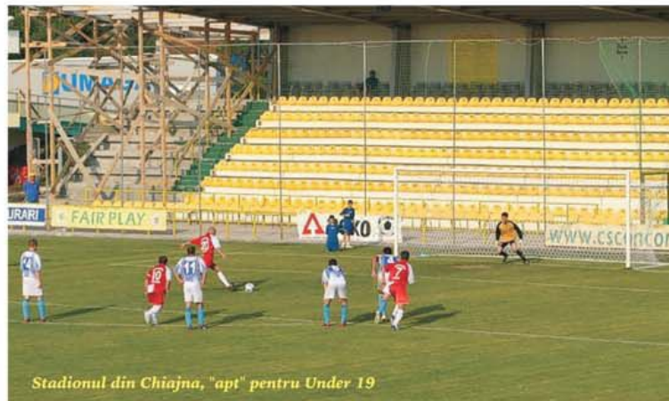
Stadionul din Chiajna, "apt" pentru Under 19

La 8 iunie, România Under 19, antrenor Lucian Burchel, își va afla adversarele din