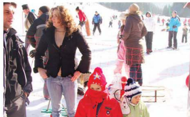
De la mic, la mare, toată lumea a fost tare...