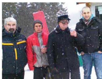
Un ceai fierbinte, mai ales pentru spectatori, e binevenit