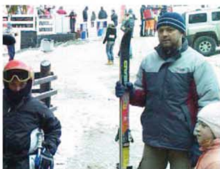
Punct și... de la capăt, la "Plecare"