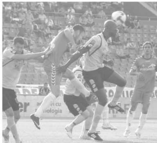
În tur, FC Timișoara - Oțelul Galați 2-1