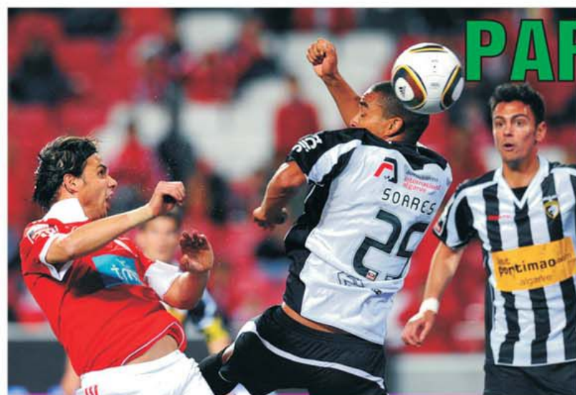
Rezultat surprinzător la meciul Benfica - Portimonense, din etapa a 23-a a campionatului portughez! Lanterna roșie, Portimonense, a scos un egal de senzație, 1-1, bașca faptul că a condus până în minutul 78, când Gomes (în stânga) a adus egalarea. Cota pentru victoria Benficăi a fost 1.10!