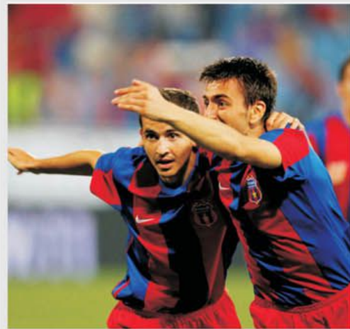
Steaua a ieșit ultima din Europa. Surdu îl vrea pe Stancu înapoi!

Cum stăm prost, doar nu la mâna norocului venit