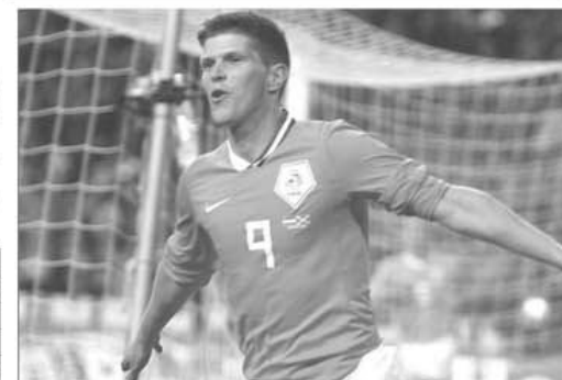
Klaas-Jan Huntelaar (Olanda), golgeterul grupei E, cu 8 goluri marcate în 4 meciuri

Depunerea buletinelor de joc la concursul PRONOSPORT din 29 martie 2010 se poate face începând de luni, 21 martie, și până duminică, 29 martie, orele 14.00. Pe buletinele de joc NU SE VA MARCA RUBRICA DA, MIERCURI