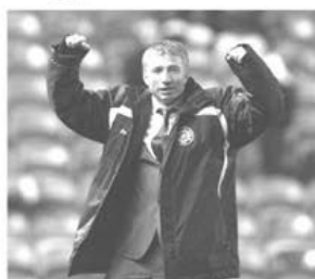
Dan Petrescu, antrenorul care a reușit pe Kuban Krasnodar în elită.