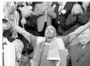
El Hadji Diouf, venit de curând la Gl.Rangers, a obținut, deja, primul trofeu cu noua sa echipă, Cupa Ligii