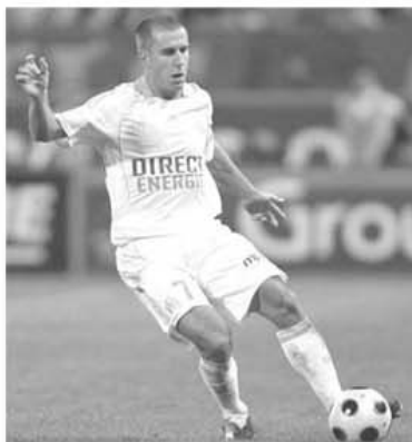
Benoît Cheyrou și-a mai dovedit o dată valoarea, înscriind golul victoriei pentru Marseille