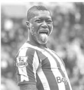
Djibril Cissé, golgeterul lui Panathinaikos și al campionatului elen, autor a 19 goluri