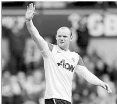
Cu un hat-trick de senzație, reușit în numai 14 minute, Wayne Rooney a întors rezultatul în favoarea echipei sale, Manchester United, în partida cu West Ham

Etapa viitoare (9-11 aprilie): Aston Villa - Newcastle; Blackburn - Birmingham; Blackpool - Arsenal; Bolton - West Ham; Chelsea - Wigan; Liverpool - Manch City; Manch Utd - Fulham; Sunderland - WBA; Tottenham - Stoke; Wolves - Everton.