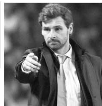
Tânărul antrenor al noii campioane, André Villas Boas (33 ani), care n-a jucat niciodată fotbal