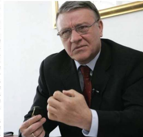
Mircea Sandu și negarea negației

meciul cu Bosnia să se dispute în Giulești! E prima lui măsură la toate „măsurătorile” lui Mircea Sandu, singurul care poate decide schimbarea selecționarului. Prin manevra de la prezidiul Comitetului Executiv, președintele Mircea Sandu nu mai are cale de întors - rămâne cu Răzvan Lucescu selecționar, iar dacă o fi să fie să se piardă meciul cu Bosnia, abia atunci dacă va umbla la „cutia cu minuni” din care poate