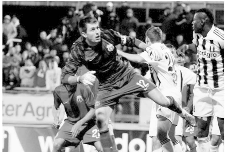
Pasat la Astra, N'Doye a sunat stingerea pentru Steaua

Aminteam, la început, de anumite nefăcute. Vezi aici, pericolul de nelicențiere a lui FC Timișoara, CCA cu