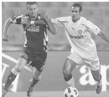
Zicu mai dă un gol, dar gratuit la prima înfrângere a Timișoarei în acest campionat

Coroborate, rezultatele apărute duc la aceeași rezultată: formarea unui melee ce se va rostogoli până spre ultima etapă dincolo de linia de finiș. Pe care poate scrie, în chirilice, FC Vaslui! Oțelul a redevenit lider pe un punct