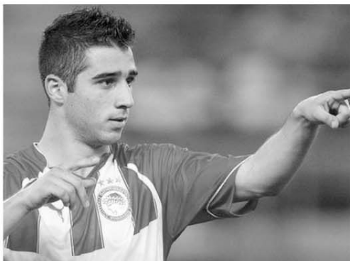
Ioannis Fetfatzidis, 20 de ani, a primit o ofertă de transfer de 10 milioane de euro de la Arsenalul lui Wenger