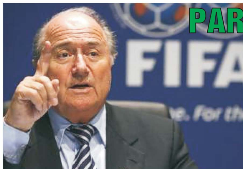
Joseph Blatter, reales, la al... patrula congres și mandat!