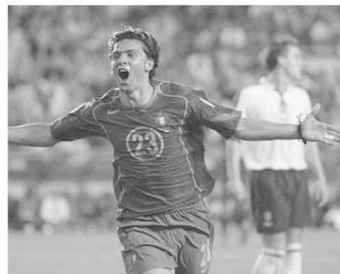
Helder Postiga a adus trei puncte mari Portugaliei prin golul marcat împotriva Norvegiei

și un egal, ar fi menținut un avantaj minim față de urmăritoare. Dar, după cum știți, s-a terminat 1-0 pentru