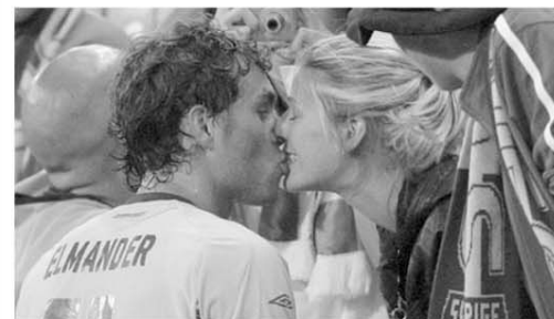
Johan Elmander, marcatorul unei duble la Chișinău, știe să-și fină fanii aproape