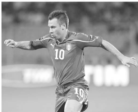
Antonio Cassano, băiatul rău al fotbalului italian, traversează o perioadă excelentă, mărturie stând golul marcat balticilor

Și Squadra Azzurra se poate considera ca bagajele făcute pentru Polonia și Ucraina. Un sec 3-0 cu Estonia și Prandelli este în grafic. Rossi și Cassano au rezolvat