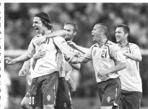
Zlatan Ibrahimovic a reușit contra Finlandei un hat-trick rapid, în numai 22 de minute!

golului marcat de Hansen. În ciuda acestui succes, naționala din Insulele Feroe continuă să fie pe ultimul loc, cu patru puncte, într-o grupă C dominată autoritar de Italia. Din cauza victoriilor repurtate de Belarus și Bosnia, România a căzut pe locul patru în Grupa D. La Minsk, naționala Belarusului și-a consolidat locul secund după victoria cu 2-0 obținută, pe teren propriu, cu Luxemburg. Codașu grupei a rezistat în prima repriză, însă Belarusul a deschis scorul imediat după pauză, prin Kornilenko, din penalty, și a închis tabela după reușita lui Putilo, din minutul 73. Tot marți, Bosnia a învins Albania cu 2-0 și a revenit în fața României în clasament. Gazdele au deschis scorul în minutul 67, prin Medunjanin, și l-au majorat în prelungiri, după golul lui Maletic, într-un moment în care albanezii jucau în inferioritate numerică, în urma eliminării lui Lila.