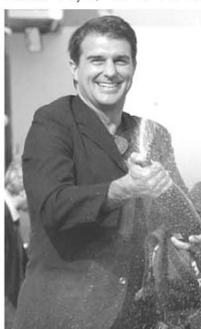
Joan Laporta a fost președintele Barcei între 2003 și 2010

Astfel, jucătorii Lionel Messi, Andres Iniesta și Carles Puyol, de la FC Barcelona, Samuel Eto'o