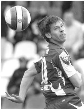
Fedor Smolov a marcat pentru Dinamo Moscova și a adus echipei sale trei puncte în deplasarea la Krasnodar