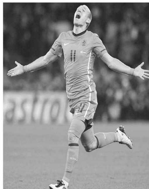
Arjen Robben - Olanda