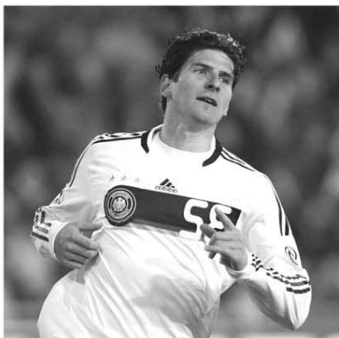
Atacantul lui Bayern Munchen, Mario Gomez, nu a ratat ocazia de a marca și pentru naționala Germaniei

Marți s-a disputat încă o etapă din cadrul preliminariilor pentru Campionatul European 2012 ce va avea loc în Ucraina și Polonia. În grupa României s-au disputat două partide, ambele câștigate cu 2-0 pe teren propriu de contracandidatele la locul secund. După ce, săptămâna trecută,