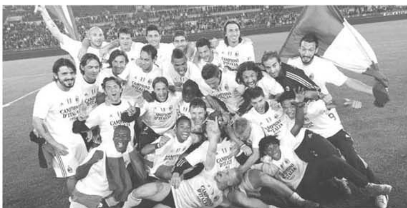
Jucătorii lui AC Milan savurându-și succesul, trofeul cucerit câștigându-și locul pentru a 18-a oară în vitrina clubului milanez

multe goluri primite (63- o medie de 1,65 goluri încasate / meci), o defensivă care nu lasă loc de vise pentru o poziție spre vârful piramidei.