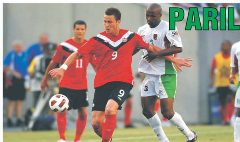
Fază (tare) din partida Canada - Guadelupa terminată cu scorul de 1-0 pentru prima echipă. Competiția în sine, Gold Cup America, în care s-au confruntat cele două reprezentative, ține așful, în această perioadă, la Pariloto. Provocare, așa că jucați, căci nu se știe de unde sare iepurele pariloteristic!