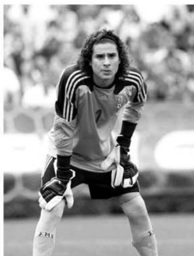
Guillermo Ochoa, portarul titular al naționalei Mexicului, a fost depistat pozitiv la un control antidoping