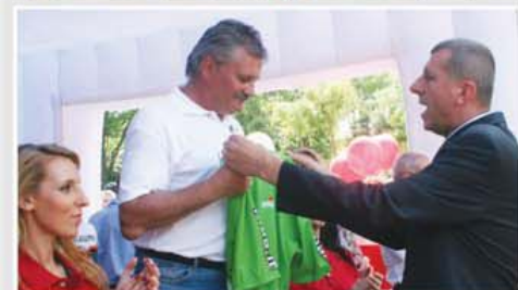
În final cu un ditamai Tricou Verde de președintele Federației de Ciclism și

cel căruia, mai nou, i se spune Fitipaldi!