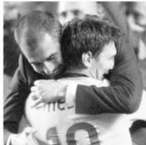
Lionel Messi îl îmbrățișează după fiecare gol pe antrenorul său Pep Guardiola

“Am învățat multe cu Guardiola antrenor. Și am și crescut foarte mult, fără nicio îndoială, cu el antrenor. Simt că sunt mai bun cu Pep lângă mine și vreau să fiu și mai bun zi după zi.