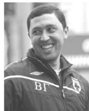
Deși are numai 30 de ani, Vladimir Gazzaev este un antrenor ambițios și o poate readuce pe Alania pe prima scenă a fotbalului rus