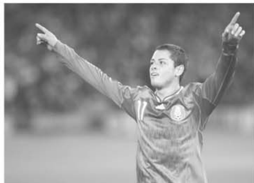
Javier Hernandez (Mexic) este golgeterul competiției cu cinci goluri marcate în primele două meciuri ale grupei

Mesa a povestit că, după meciul pierdut în fața Mexicului, scor 0-5, a fugit pe scara de incendiu a hotelului, fiind așteptat de o mașină în care se aflau membrii familiei sale.