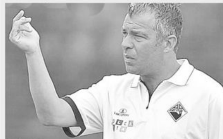
"Animalul" e în cantonament cu CFR, dar ar putea să ajungă la Portof!