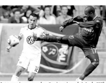
Intervenție spectaculoasă a jamaicanului Andy Williams în remiza echipei sale, Salt Lake, cu DC United