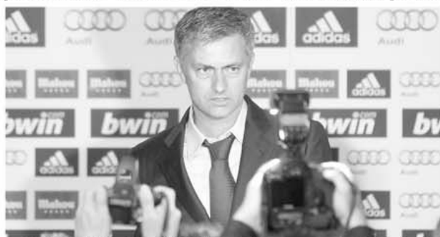
La Porto, Chelsea și Inter, Mourinho a câștigat măcar un trofeu în primul an și cel puțin titlul de campioană națională în al doilea. Urmează...

campioanelor cu Hercules, 0-2 acasă, și a avut un scurt parcurs mai bun față de bătău rivalul, fiind lider în rundele 7-12. Dar a mers ora primului Clasic din seria ce va avea să