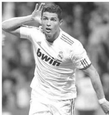
Cristiano Ronaldo a tranșat duelul cu Messi în privința golurilor marcate în Primera Division

La finalul ediției 2009-10 s-a considerat că Pellegrini nu a fost cea mai bună soluție pe banca tehnică și s-au făcut eforturi deosebite pentru aducerea lui Jose Mourinho. Acesta a considerat că lotul nu trebuie remaniat radical și astfel s-au plătit mai puțini bani pentru achiziții, dorite de portughez: Ricardo Carvalho (Chelsea), Khedira (Stuttgart), Ozil (Bremen), Di Maria (Benfica) și Adebayor, împrumutat în ianuarie de la Manchester City, pe lângă care au mai sosit Canales (Santander) și Pedro Leon (Getafe). La capitolul "plecări", în afara lui Raul și Guti i-am mai notat pe Van der Vaart (Tottenham), Metzelder (Schalke) și Drenthe, împrumutat noii promovate Hercules.