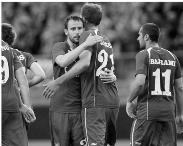
Marc Janko, autorul celor două, goluri ale lui FC Twente