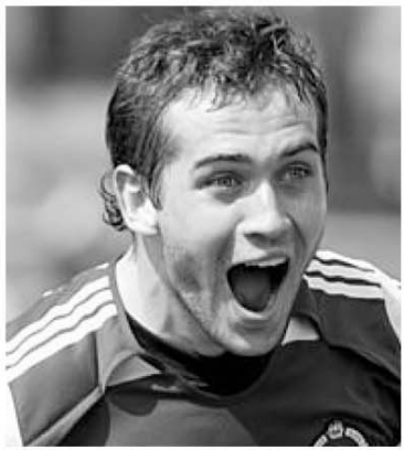
Alexander Kerzhakov, jucătorul al cărui gol a decis victoria lui Zenit la Makhachkala.

Etapa viitoare (30-31 iulie): Tom Tomsk - Terek Grozni; Rubin Kazan - Anzhi Makhachkala; Spartak Moscova - Kuban Krasnodar; Rostov - Lokomotiv Moscova; Dinamo Moscova - Volga Nizhniy Novgorod; Zenit St. Petersburg - Spartak Nalchik; FK Krasnodar - TSKA Moscova; Krylya Sovetov - Amkar Perm.