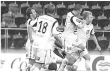
La cinci zile după ce a împlinit 24 de ani, "nouarul" Soderlund a realizat o "triplă" pentru Haugesund (32', 41', 44')