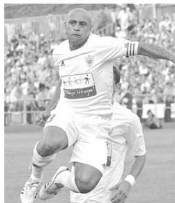
La 38 de ani, brazilianul Roberto Carlos rămâne un fotbalist de clasă, fiind căpitanul și vedeta indiscutabilă a celor de la Anzhi Makhachkala