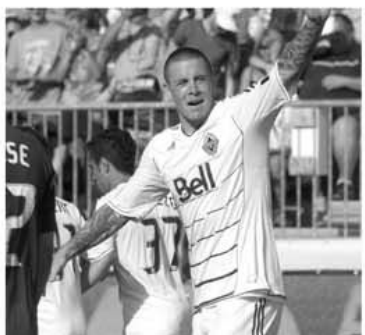
Cu golurile marcate lui Chicago (1', 72'), înaltul atacant francez Eric Hassli (1,93m) a ajuns la 10 reușite, cu una mai puțin decât primii marcatori din MLS, Thierry Henry și Landon Donovan