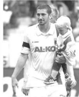
Cu golurile sale (53', 81'), Sascha Molders a adus primul punct din istoria lui Augsburg în Bundesliga