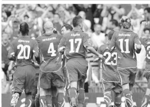
Elveția a smuls o remiză Angliei la 4 iunie 2011

Depunerea buletinelor de joc la concursul PRONO-S din 2-3 septembrie 2011 se poate face începând de luni, 29 august, și până joi, 1 septembrie, orele 16.00. Pe buletinele de joc SE VA MARCA rubrica DA, MIERCURI