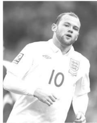
Anglia lui Wayne Rooney are o misiune dificilă în deplasarea de la Sofia, cu Bulgaria

în cazul unui "1, X", croații trecând la "timonă", fiind greu de crezut că se vor