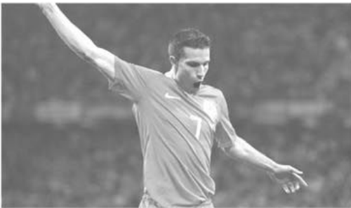
Van Persie (Olanda) are în meciul cu San Marino șansa să marcheze cât mai multe goluri