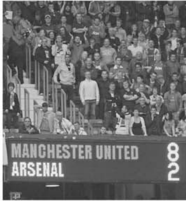
"Tabelă de marcaj" neverosimilă pentru un mare derby!

Etapa viitoare (10-12 septembrie): Arsenal - Swansea; Bolton - Manch Utd; Everton - Aston Villa; Fulham - Blackburn; Manch City - Wigan; Norwich - WBA; QPR - Newcastle; Stoke - Liverpool; Sunderland - Chelsea; Wolves - Tottenham.