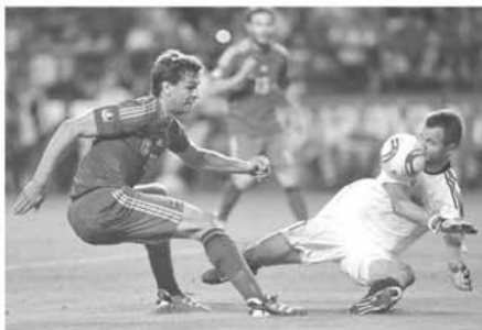
Scorul etapei din 6 septembrie a fost înregistrat la partida dintre campioana mondială, Spania, și modesta Liechtenstein

Danemarca s-a impus în fața Norvegiei, iar acum, în grupa H, sunt nu mai puțin de trei formații cu 13 puncte. În derby-ul suferinței, Islanda s-a impus cu 1-0 în fața echipei din insula Afroditei. În sfârșit, în grupa I, Scoția a trecut de Lituania și mai speră încă la baraj, în timp ce Spania a jucat un set de tenis cu Liechtenstein și așteaptă anul viitor pentru a-și apăra trofeul.