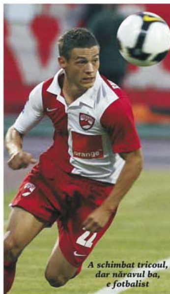
A schimbat tricoul, dar năvălul ba, e fotbalist

reface în întregime câmpul de joc. Astfel încât echipele românești participante în cupele europene să poată disputa jocurile din grupele Ligii Campionilor și din Europa League. Mai puțin, pentru început, jocul Stelei, cu Schalke, de joi, care se va disputa la Cluj, pe arena lui CFR!