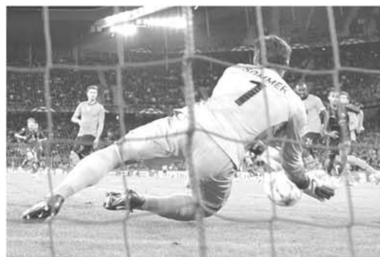
Ratate, ratate, ratate și Oțelul rămâne pe zero!

Au jucat echipele: FC Basel: Sommer-Strehovici, Abraham, Dragovic, Park Joo-Ho, F. Frei (Pak 90), Huggel,