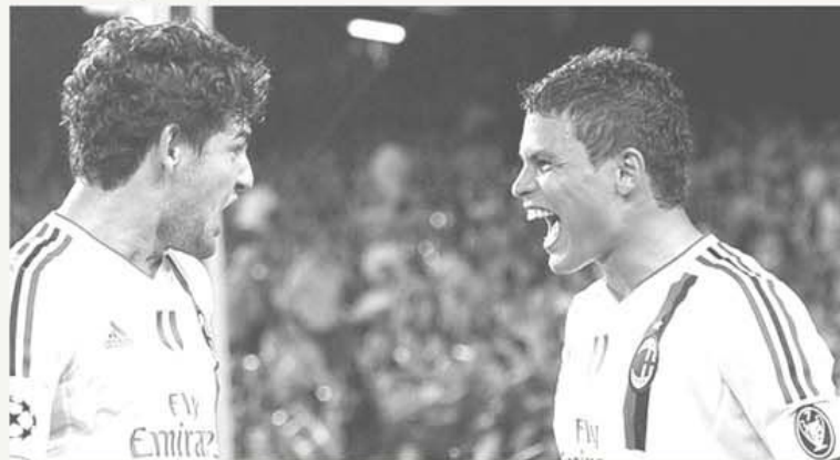
Pato și bucuria golului la un meci cu Barcelona

Mircea Lucescu s-a luat din nou de arbitrii. Il Luce nu a "digerat" deloc