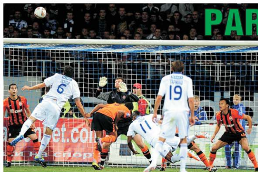
Fază fierbinte la derby-ul fotbalului ucrainean, Dinamo Kiev - Șahtior. Fierbinte a fost, de altfel, tot meciul, deși s-a terminat cu un scor alb. Pentru prima dată din 2006 încoace, trupa lui Lucescu pleacă neînvinșă de la Kiev și conduce în clasament, la golaveraj în fața aceluiași Dinamo Kiev, ambele la egalitate de puncte, 27, după unsprezece etape.