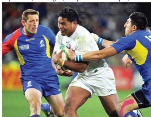
A trebuit să ajungem tocmai în Noua Zeelandă pentru a înțelege că în sportul cu mingea turtită... suntem departe!