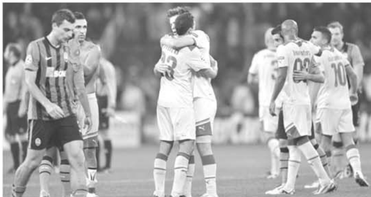
Jucătorii de la APOEL, se bucură de punctul scos pe terenul lui Șahtior, care a cam uitat gustul victoriei în ultimul timp