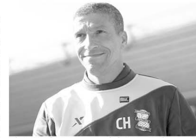
Chris Hughton, managerul lui Birmingham, este multumit după victoria echipei sale în fața lui Leicester