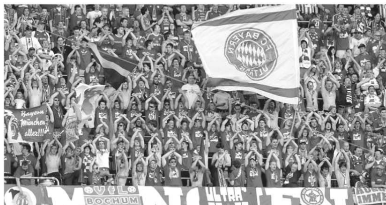
Supporterii lui Bayern Munchen sunt printre cei mai civilizați din Europa, însă, cu toate acestea, au avut mari probleme la Napoli