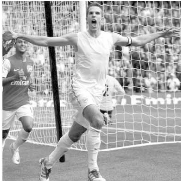
Robin van Persie (Arsenal) a realizat, în secunda 29 a meciului cu Sunderland, cel mai rapid gol, în acest sezon, în Premier League

Arsenal - Stoke; Aston Villa - WBA; Blackburn - Tottenham; Bolton - Sunderland; Fulham - Everton; Liverpool - Norwich; Manchester Utd - Manchester City; Newcastle - Wigan; QPR - Chelsea; Wolves - Swansea.