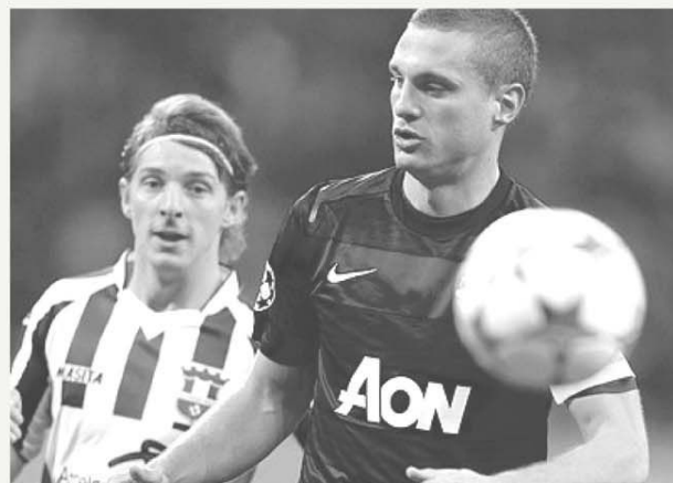
Gălățenii au privit și de de data aceasta spre un balon, balon pe care scrie Champions League, dus de vânt spre alte zări. Totul să se ducă de Răpă? Pe Old Trafford, la "revanșa" cu MU, același balon? Pentru că pe Național Arena au fost, marți, două ceasuri rele, penalty-urile lui Rooney

lovitură de cap, vigilența lui Lindegaard, pentru că oaspeții, deliberat, renunță la ofensivă. Perendija e și el eliminat, iar în prelungiri (90+2), Rooney înscrie, din