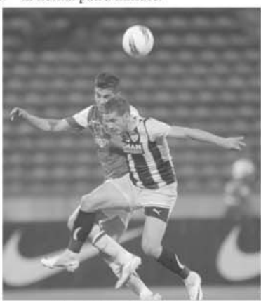
Duel neconvingător într-un meci în care câinii plecau favoriți

retrogradare, așa se întâmplă. Când mai dai și din jucători, fără discernământ... La Târgu Mureș n-a fost vorba de penalty. Oțelul s-a trezit dintr-un somn lung, într-un meci al cărui scor s-a scris în numai patru minute.