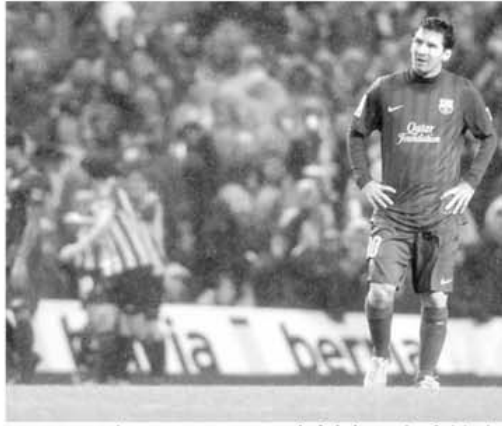
Ipostază mai rar văzută pe un teren de fotbal: Messi nefericit și indignat, cu adversarii, jucătorii lui Athletic, jubilând

Așa cum recunoștea și Guardiola, Barcelona nu se află la un nivel ridicat. În fața unui antrenor cu aceeași filozofie de joc și care l-a influențat în meseria de antrenor, argentinianul Bielsa, catalanul a plecat cu o remiză norocoasă de la Bilbao, a treia în deplasare cu același scor. Astfel că singura neînvinsă este la trei puncte în spatele lui Real. Elevii lui Mourinho au oferit și ei un recital în compania aceluiași echipe zdrobite pe Camp Nou cu 8-0, cu Cristiano Ronaldo, recent "posedor" de Gheată de Aur, realizând al patrulea său hat-trick în 11 runde scurse. În afara victoriei lui Real, să remarcăm faptul că din cele numai patru consemnate, încă două au implicat echipe madrilenle.