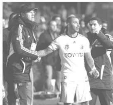
Quaresma, unul din cei \u015ase portughezi ai lui Be\u015fikta\u015f, a transformat penalty-ul ('78) care a aruncat-o pe Trabzon patru locuri mai jos

Antalya - Karab\u00fck; Kayseri - Istanbul BB; Sivas - Trabzon; Gaziantep - Samsun; Mersin - Manisa; Fenerbah\u00e7e - Ankarag\u00fc\u00e7\u00fc; Be\u015fikta\u015f - Ordu; Gen\u01c7lerbirli\u0131i - Galatasaray; Bursa - Eski\u015fehir.