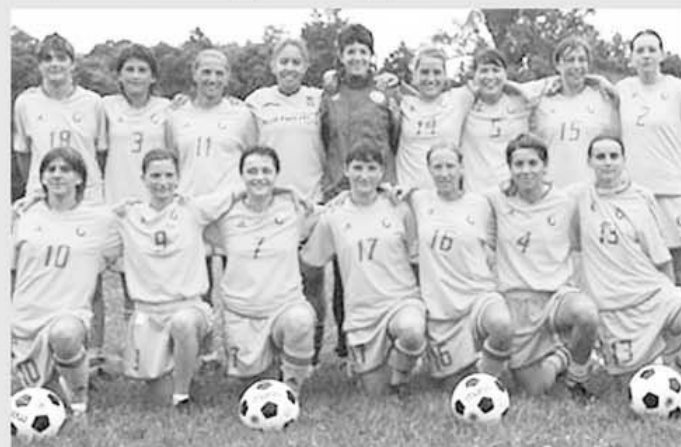
Toate, un zâmbet pentru preliminarii în viitor

târziu, s-au mai jucat două meciuri în grupă, și anume Elveția - Kazahstan 8-1 și Spania - Germania 2-2. La final de an, clasamentul grupei arată astfel: 1. Spania 13 puncte din 5 jocuri, 2. Germania 10 puncte din 4 meciuri, 3. România 9 puncte din 6 meciuri, 4. Elveția 6 puncte din 4 meciuri, 5. Kazahstan 4 puncte, din 6 meciuri, 6. Turcia 1 punct, din 5 meciuri. Așadar, Spania și Germania continuă disputa pentru supremație în grupă, cea care asigură calificarea directă la turneul final din Suedia, din iulie 2013. Perdanta acestui duel urmează fie să se califice, la rândul-i, dacă va fi cea mai bună dintre echipele de pe locul secund în cele șapte grupe, fie să joace unul dintre cele trei meciuri de play-off. În ceea ce privește reprezentativa României, va concura, vorba vine, cu Elveția la locul trei, așa de palmares. Grupa a 2-a de calificare se va relua anul viitor, cu următoarele meciuri: Turcia - Germania, la 15 februarie, Germania - Spania, Romania - Kazahstan și Elveția - Turcia, toate trei la 31 martie.