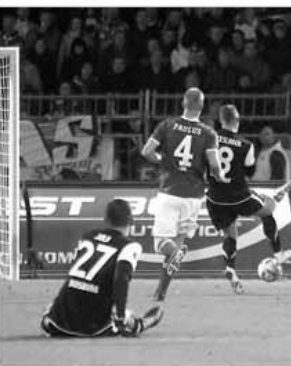
Maurice Exslager (nr. 8), intrat în min. 62, a marcat un gol de trei puncte pentru "zebră" în primul minut al prelungirilor meciului de la Aue