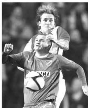
Imagine spectaculoas\u0103 surprins\u0103 \u00een "remiza alb\u0103", Slavia Praga - Banik Ostrava, care a \u00eencheiat luni, 28 noiembrie, turul campionatului