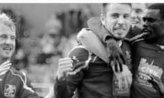
La Silkeborg, fundașul Kildentoft a marcat două din cele trei goluri ale meciului, primul în poarta echipei sale (56) și celălalt în cea a gazdelor (89)

Etapa viitoare (3-5 decembrie): Silkeborg - Aalborg; Nordsjælland - Midtjylland; Køge - Brøndby; Lyngby - Horsens; FC Copenhagen - Aarhus; SonderjyskE - Odense.