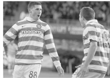
Golgeterul campionatului scoțian, Gary Hooper (nr.88), a înscris, în minutul 12, unicul gol al partidei disputate de echipa sa, Celtic, în deplasarea de la Dundee