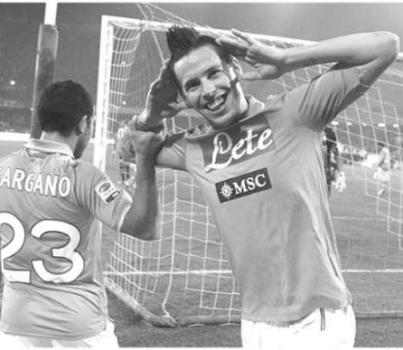
Marek Hamsik sărbătorește calificarea napoletanilor în optimile Ligii Campionilor

Campionilor a consemnat eliminarea surprinzătoare a celor două mari echipe din Manchester, finalista de anul trecut,