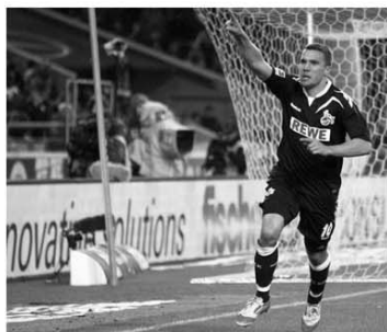
Internaționalul Lukas Podolski a deschis și a închis tabela la Stuttgart, punctând în min. 15, din penalty, și 88 pentru "tapi"