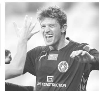
Înaltul atacant albanez Edgar cani (1,92m) a marcat golurile Poloniei (9, 14, 43)