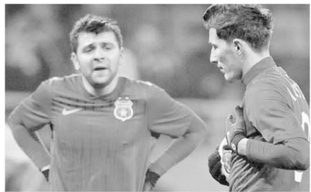
Cuplul de golgheteri ai Stelei, se întreabă de ce numai trei!