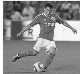
Vineri, 2 decembrie, Saviola a transformat un penalty pentru Benfica deschizând scorul în meciul cu Marítimo din optimele Cupei, dar adversarii au câștigat cu 2-1 și s-au calificat mai departe