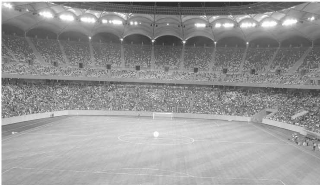
Național Arena și-a deschis porțile pentru Liga I. Derby-ul Steaua - Rapid s-a disputat aici, pe Național Arena, în fața unei asistențe record pentru acea dată, 23 octombrie 2011

13 la FC Brașov: Felgueiras, Madeira, Moutinho, Sousa, Viveiros, Machado - din Portugalia, Majernik - din Slovacia, Toloza, Paez - din Chile, Distefano, Dominguez - din Argentina, Velayos - din Spania, Kanu - din Brazilia