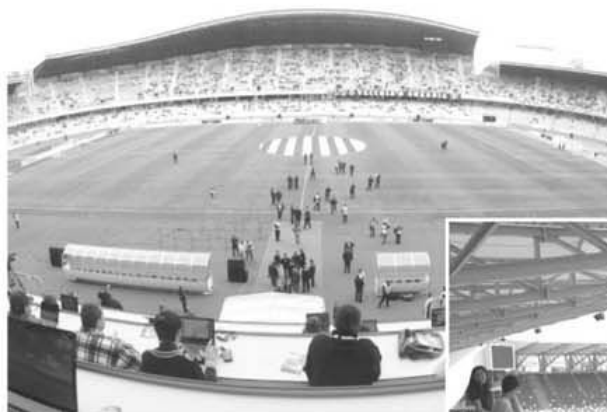
Cluj Arena, loc de "nebulii" pentru Șepcile roșii

Cele mai multe egaluri afară - 5 - Pandurii și Petrolul.