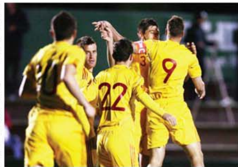
Săgeată înscrie și vă... zbură (săgeată) spre China

apropiat, cel prezent și prezentat, cu câteva "plombe", bineînțeles, la Belek. Cel puțin așa susține selecționerul și nu sunt motive (Mutu, Chivu, Torje, Niculae, Tamaș și... alții), cel puțin pentru moment, care să nu-i susțină afirmațiile. Mai ales că echipa, așa cum e, or strâmba unii din nas la auzirea numelor prezente la lot, în Antalya, va mai avea, în primăvară, un stagiul de pregătire centralizată, prilej de ungere a