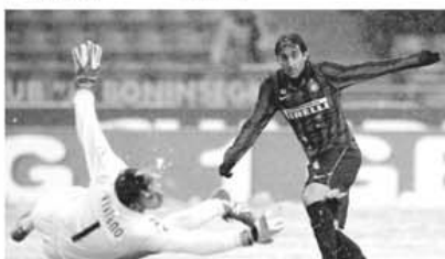
În tricoul lui Inter, Diego Milito a marcat prima dată de patru ori (22, 55 - 11m, 61, 69) într-un meci din fotbalul italian, până la ora partidei cu Palermo contabilizând trei "triple", toate cu Genoa