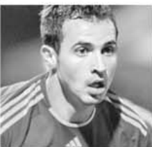
Bogdan Stancu a marcat din nou pentru naționala României

Echipa națională a României a terminat la egalitate, pe teren propriu, scor 1-1, cu reprezentativa Uruguayului, campioana la zi a Americii de Sud, într-un amical disputat pe Arena Națională. "Celestii" au deschis