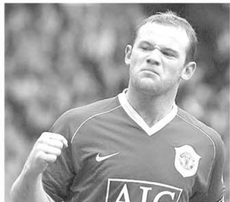
Wayne Rooney (Manchester United)