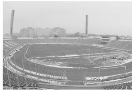
Stadionul "Farul", pe unde a trecut, în dese rânduri, Naționala lui Pifturcă

Pe parcursul anului trecut, la tradiție, dacă vrei, ne-am ocupat, cât de cât, mai străveziu, așa zice, de Liga a II-a. Așa că pentru o... mai bună cunoaștere, un compendiu de statistică se cerea și pentru acest eșalon al fotbalului românesc.