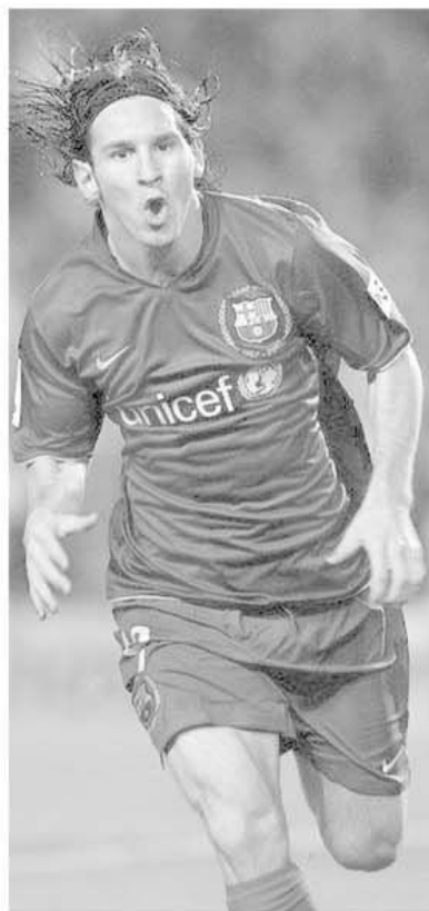
Leo Messi a marcat o "manita" contra lui Leverkusen