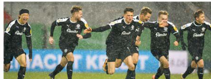
Buturuga mică din Kiel a răsturnat caleașca aurită a celui mai galonat club din Germania

până în minutul 75 pe golgerul Lewandowski, dar nu au tratat Cupa cu dispreț, având mulți titulari pe teren. A fost o vreme dușmană fotbalului, cu ninsore și vânt puternic în timpul meciului, dar terenul a rămas impecabil, ca urmare a sistemului perfect de drenaj. Holstein Kiel a făcut meciul vieții și părea că va muri frumos, pentru că în minutul 94 Bayern conducea cu 2-1. Când a venit din cer golul care a trimis meciul în niște prelungiri puțin