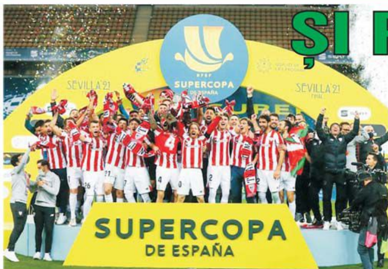
Duminică, pe Estadio de La Cartuja din Sevilla, Athletic Bilbao a cucerit Supercupa Spaniei învingând Barcelona cu 3-2 după prelungiri. În semifinale, Athletic trecuse de Real Madrid cu 2-1, joi, la Malaga, iar Barcelona de Sociedad cu 3-2 la loviturile de departajare, miercuri, la Cordoba.

• Concursul Prono-S a avut la start un report de peste 37.000 de lei, adunat de la primele două categorii, și va fi omologat în cursul zilei de astăzi, deoarece partida Cagliari - Milan s-a disputat aseară, după închiderea ediției revistei noastre. "Schedina" a cuprins toate cele 10 meciuri din etapa a 18-a din Serie A plus un meci din Serie B, între primele două clasate, și până la jocul de ieri nu se consemnase niciun "2"! Dintre semnele apărute, doar "X"-ul de la Atalanta - Genoa pare nelalocul lui. (E.I.)