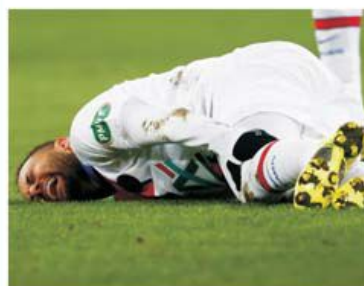
Brazilianul Neymar ratează șocul Barcelona-PSG și reîntâlnirea, ca dușmani, cu prietenul Leo Messi

Revin în actualitate meciurile din cadrul competițiilor europene intercluburi. Cu primele patru partide tur din optimile Champions League și