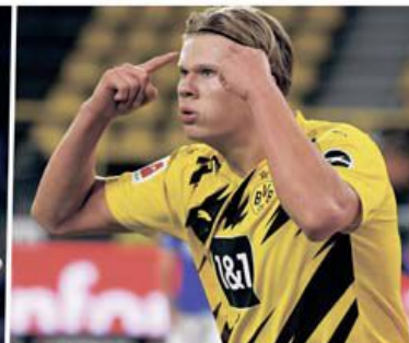
Kylian Mbappe și Erling Haaland, urmașii lui Messi și Cristiano Ronaldo

din 2021 din Champions League au avut multă adrenalină și au trimis în lumina reflectoarelor două nume de vedete incontestabile: francezul Kylian Mbappe și norvegianul Erling Haaland.