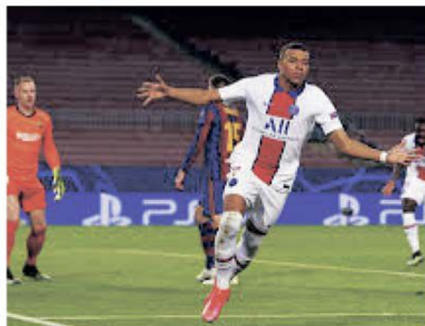
Mbappe nu uită și nu iartă. A reușit un hat-trick de senzație pe Nou Camp în Barcelona - PSG 4-1