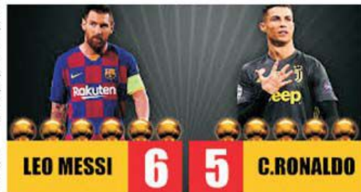
Lionel Messi și Cristiano Ronaldo au împreună 11 Baloane de Aur în ultimii 15 ani, 6-5 pentru argentinian

La Torino, după ce Juventus pierduse cu 2-1 în Portugalia, toată lumea aștepta ca starul Cristiano Ronaldo să devoreze cât mai mulți dintre dragonii alb-albaștri din Porto și să își ducă echipa în sferturi. Însă, ca și la Porto, fanii lui Juve l-au așteptat degeaba pe Cristiano, acesta fiind prezent doar fizic, fără a reuși nici măcar o singură jumătate de ocazie să își creeze. Nu a fost însă suficient. Avea să fie tocmai cel mai bine plătit jucător din