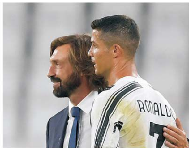
Antrenorul Andrea Pirlo și starul Cristiano Ronaldo sunt arătați cu degetul pentru eliminarea lui Juventus din Champions League