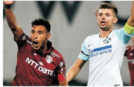
Meciurile dintre FCSB și CFR Cluj au fost întotdeauna extrem de disputate și foarte echilibrate

Etapa a 27-a din Casa Pariurilor Liga 1 nu a schimbat cu nimic ordinea primelor trei locuri, pregătind astfel momentul cel mai așteptat al finalului de sezon regulat, meciul care va stabili cine va fi prima în clasament la capătul celor 30 de etape, FCSB - CFR Cluj. Etapa a 28-a va stabili și un adevărat record de durată în fotbalul românesc, pentru că se va întinde pe durata a nu mai puțin de șase zile, începând marți, 16 martie cu partida Craiova - UTA și încheindu-se tocmai duminică, 21 martie, cu Sepsi - Gaz Metan. Însă momentul adevărului se va produce vineri, 19 martie, de la ora 20:30, pe Arena Națională. FCSB, care continuă să nu mai impresioneze cum a făcut-o până la plecarea lui Dennis Man la Parma, dar obține esențialul, cum a fost și acest 1-0 de la Arad, salvat în ultimul minut de parada lui