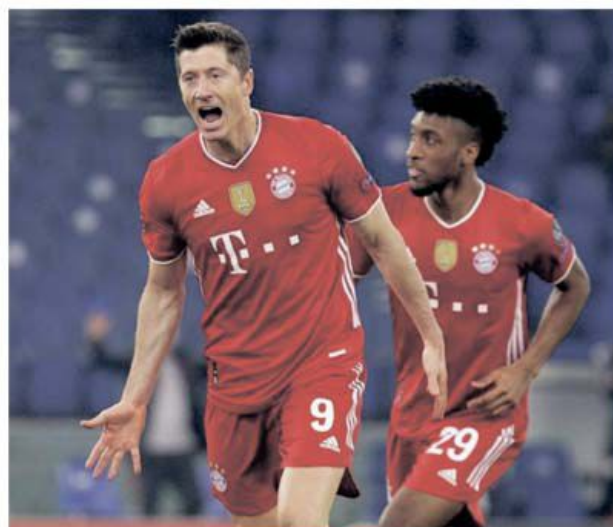
Bayern Munchen, cu golgeterul ei, polonezul Robert Lewandowski, e deținătoarea trofeului și marea favorită să repete succesul