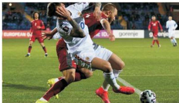
România a fost KO și la propriu și la figurat în Armenia, iar șansele de a mai ajunge la Mondialul din 2022 au scăzut simțitor

Și așa jocul nostru fusese de multe ori un chin în propriul careu,