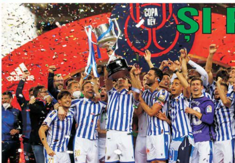
Sâmbătă, 3 aprilie, a avut loc la Sevilla finala Cupei Spaniei ediția 2020, de acum un an, între cele două echipe basce, Athletic Bilbao și Real Sociedad. Meciul a fost amânat timp de un an pentru că s-a vrut se joace cu spectatori, însă solicitarea nu a fost acceptată. A câștigat Real Sociedad cu 1-0, primul trofeu după o așteptare de 35 de ani.