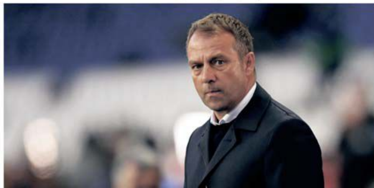
Hansi Flick, de la Bayern Munchen la viitorul selecționar al Germaniei

scaunul celei mai galonate echipe germane timp de opt ani a fost asistentul lui Joachim Low la naționala Germaniei. Și tocmai circuitul început în 2006 și încheiat în 2014 este acum foarte aproape să fie reluat, dar dintr-o cu totul altă poziție. Joachim Low va încheia