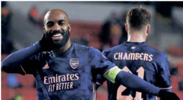
Francezul Alexandre Lacazette a fost cel mai bun jucător al lui Arsenal în deplasarea cu Slavia Praga

rezultatelor, în semifinale se vor juca partidele AS Roma - Manchester United și Arsenal - Villarreal.