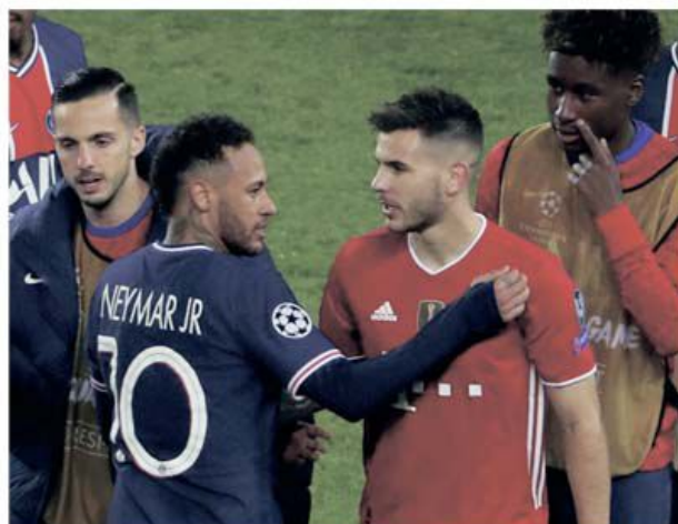
Brazilianul Neymar, care a fost la un pas să-și îmbolnăvească fanii și coechipierii, îi consolează pe germani

a avut aportul uriaș al celui 12-lea jucător, fantasticul public de pe Anfield Road. Acum cetatea cormoranilor a arătat ca un bastion pustiu, nici măcar uriașa pancartă cu mottoul clubului, You never walk alone, nu a mai putut aduce energie jucătorilor. Poate că dacă Mo Salah ar fi marcat la prima secvență de atac a meciului, când a tras singurel din 6 metri