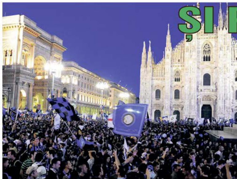
10 ani au așteptat tifosii Interului un nou scudetto. Nu s-a mai ținut cont de pandemie și Piața Domului din Milano a fost ocupată de peste 20.000 de suporteri care au sărbătorit titlul

• Axat pe partidele din Spania, cu 11 evenimente din Primera Division și 2 din Segunda Division, concursul Prono-S din 1-2 mai a numărat 10 variante câștigătoare, jucate "la sfert", apărute la categoria a III-a, fiecare a câte 1.736,92 de lei. Reportul la categoria I a urcat la peste 110.500 de lei! Cele mai importante semne care au influențat această omologare au fost "2"-urile apărute la Granada - Cadiz și Sevilla FC - Ath. Bilbao, precum și "1" de la finalul meciului Huesca - Sociedad.