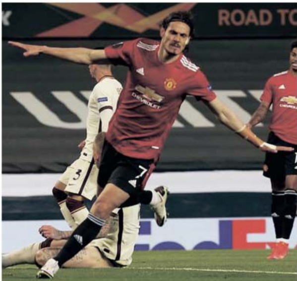
Uruguayanul Edinson Cavani a fost de departe cel mai bun jucător al lui Manchester United

Ligi Europa. Manchester United este cu un pas în finală