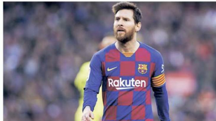
Lionel Messi e așteptat ca un rege la Paris

eliberare de pe Nou Camp și brusc acțiunile și credibilitatea jurnalistului cariocas care trăiește la Barcelona a atins cote incredibile. Așa încât acum, când a aruncat în eter știrea conform căreia șecii lui PSG au pregătit deja toate detaliile unui contract pe doi ani cu încă unul opțional pentru Leo Messi nu a mai