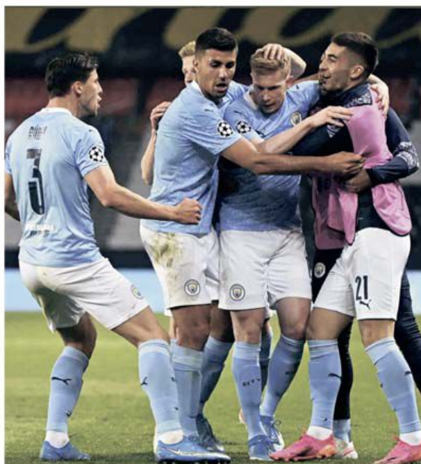
Bucurie imensă pentru cetățenii lui Pep Guardiola după victoria de la Paris, care deschide drumul primei finale de Champions League

Guardiola părea anesteziată de broderia țesăturilor de pase ale francezilor, incapabilă să găsească replică. Însă ceea ce s-a petrecut la pauză în vestiarul cetățenilor știu numai ei și Guardiola. Cert este că în ultimele 45 de minute Manchester City a trecut la butoane de o manieră categorică, pur și simplu ascunzând mingea de adversary. PSG s-a trezit în