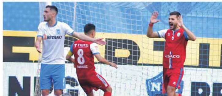
Jucătorii Botoșaniului se felicita pentru victoria din meciul cu CSU Craiova