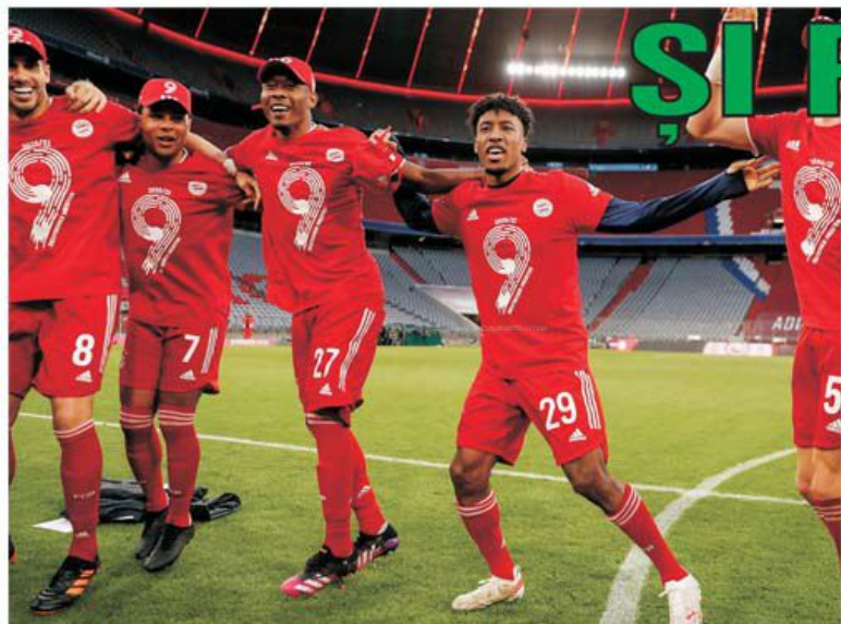
Bayern Munchen a câștigat pentru a noua oară consecutiv titlul în Bundesliga, egalând recordul lui Juventus în cele cinci campionate de top ale Europei all time. Pe locul 3 se află Lyon, cu șapte succese.

• La concursul Prono-S din 8-9 mai, construit numai cu meciuri din prima divizie din Spania și Italia, nu a apărut nicio variantă câștigătoare, astfel că întregul report – 139.464,45 de lei!, va constitui baza de plecare pentru următoarea provocare, din 15-16 mai. Toate cele trei semne ale jocului, 1, X și 2, și-au pus amprenta pe această omologare: "1" la Cadix - Huesca, Fiorentina - Lazio, atât la pauză, cât și la final, "X" la Alaves - Levante și Ath. Bilbao - Osasuna și "2" la Getafe - Eibar. (E.I.).