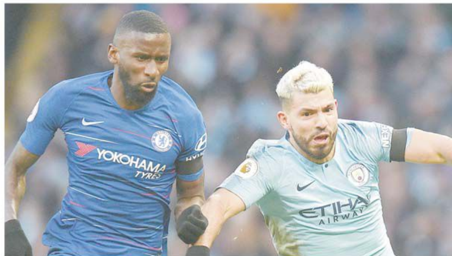
Chelsea și Manchester City se cunosc la perfecție din fotbalul din Insulă. Una dintre ele se va încunună acum și cu titlul de cea mai bună echipă a Europei

Gata, am aflat care sunt echipele care vor merge la Istanbul, pentru finala Champions League din acest sezon, în seara zilei de 29 mai, pe stadionul Olympic Ataturk! Va fi o afacere între loriții fotbalului din Premier League, eveniment care s-a mai petrecut în 2019, când Wanda Metropolitană din Madrid a găzduit ultima finală din Champions League cu spectatori în tribune, Liverpool - Tottenham 2-1. Acum au ajuns să se bată cu trofeul pe masă Chelsea și Manchester City, trupa lui Pep Guardiola cheltuind de-a lungul anilor, de când a devenit proprietatea șeicilor din Emirate, peste un miliard de euro pentru a atinge acest obiectiv. Este o premieră pentru "cetățenii" de pe Etihad Park, care sezonul acesta deja au câștigat, pentru a cincea oară, Cupa Ligii Angliei și care se pregătesc să desfacă șampaniile pentru a treia oară în patru sezoane pentru a sărbători titlul de campioni în Premier League. Însă peștele cel mare, la care visează Pep Guardiola, toată pleiada de șeici și tot vestiarul lui City rămâne trofeul Champions League, la care tehnicianul catalan a ajuns din nou după zece ani, după ce a reușit dubla la Barcelona, cu acea tripletă magică Xavi - Iniesta - Messi.