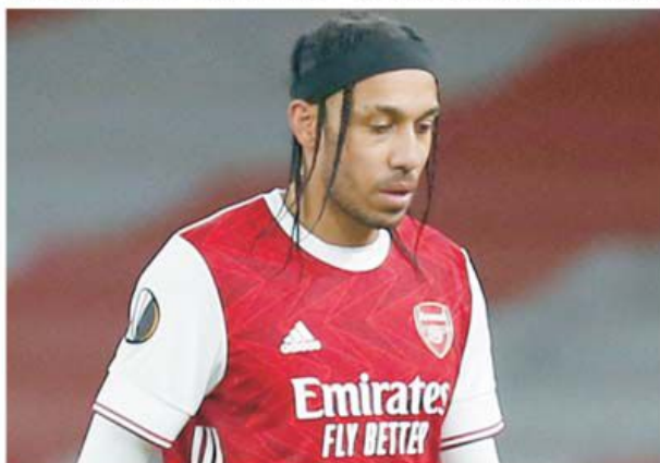
Pierre Emerick Aubameyang a lovit bara de două ori, iar Arsenal ratează calificarea în finală