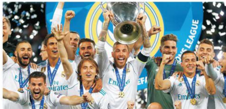
Real Madrid, recordmana de trofee Champions League, poate fi pedepsită de UEFA cu excluderea pe un an sau doi din cupele europene

peste fotbalul european și care nu admite nici un fel de inițiativă în afara intereselor sale. Pedepsa care urmează să fie luată are totuși două fețe. Una pentru cei care s-au pocăit și s-au retras din combinație, alta, evident mult mai dură, pentru cele patru cluburi care nu renunță nici acum la proiect, așteptând