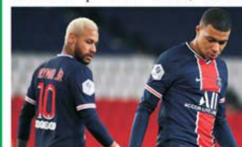
Neymar și Mbappe, îngrijorați că ar putea pierde titlul

* Ligue 1 trăiește, după ani de zile, suspansul general până la ultimele secunde ale acestei stagiuni. Doar echipele retrogradate se cunosc în zona fierbinte, Nimes și Dijon. Însă ceea ce interesează pe toată lumea, numele