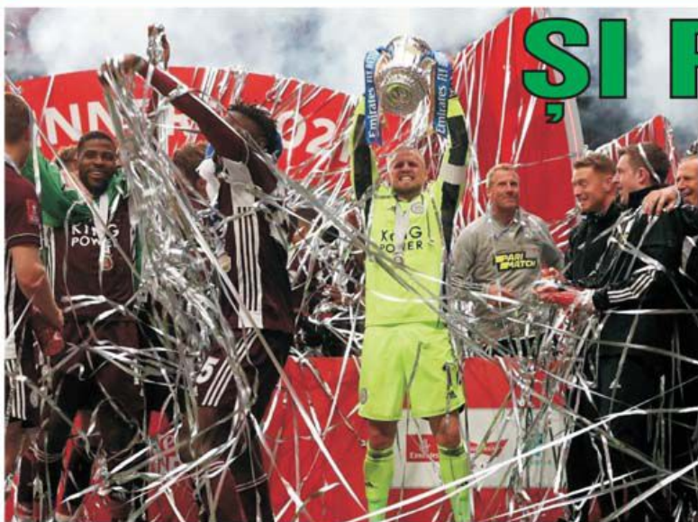
Leicester City a câștigat pentru prima oară Cupa Angliei, după 1-0 în finala cu Chelsea. De șapte ori pierduse până acum Leicester în fața londonezilor în Cupă, dar acum s-au răzburat!

• Interesant de urmărit omologarea concursului Prono-S din 15-16 mai, care are loc în cursul zilei de astăzi, după disputarea ultimului meci, Girona - Gijon, din Segunda Division, programat aseară, după închiderea ediției revistei noastre. Interesant pentru că și acesta avea la start întreg fondul de câștiguri de la concursul anterior, adică nu mai puțin de 139.500 de lei! Interesant și pentru că am numărat nouă semne de "1", consecutive!, iar per total niciunul din cele 12 de până acum nu pare să se constituie într-o adevărată surpriză. (E.I.)