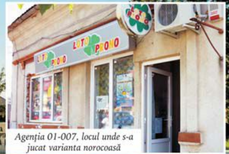
Agenția 01-007, locul unde s-a jucat varianta norocoasă