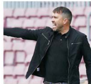
Dintre toți antrenorii angajați pe parcursul campionatului, Eduardo Coudet a realizat cel mai bun parcurs, apropiind-o pe Celta Vigo de locurile europene

Deși a urcat-o două trepte pe Huesca în ierarhie față de poziția avută la preluare, la 12 ianuarie, de la 20 la 18, Pacheta nu a reușit să evite retrogradarea. Realizează linia 20 6-4-10 20-25 22p față de 18 1-9-8 14-28 12p, a lui Michel Sanchez.