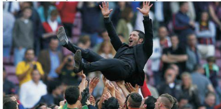
Diego Simeone, e la ani lumină de restul antrenorilor în lume la nivel salarial

mada din secolul 21, învățată să moară și să învie de câte ori trebuie, până la îngenuncherea adversarului. Un astfel de personaj nu avea cum să fie un om obișnuit nici la nivelul modului de a fi, recompensat pentru minunile sale.