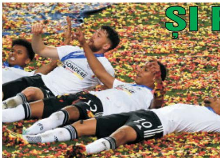
Germania a câștigat titlul european la naționalele U21, după ce a învins în finală Portugalia cu 1-0. Cu doi ani în urmă jucase finala, cedând în fața Spaniei. România lui Adrian Mutu a fost în grupă la turneul final cu Germania, reușind o remiză albă.