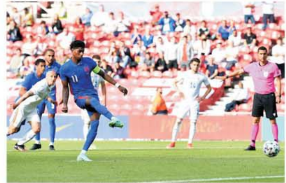
Marcus Rashford a transformat cu siguranță penalty-ul care a decis învingătoarea

Mirel Rădoi a devenit primul selecționer din istoria naționalei cu patru eșecuri la rând! „A fost o partidă grea, intensă, echilibrată. În prima repriză, ei au avut două ocazii mari, dar am reușit să ne facem jocul până la urmă. Am întâmpinat ceva probleme până am reușit să-i blocăm între linii. Sunt supărat din nou pentru că ajungem în fața porții, dar nu marcăm. Căpușă