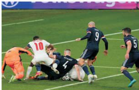
Anglia a făcut unul dintre cele mai slabe meciuri din ultimii ani în egalul cu Scoția.

Anglia este marea favorită la locul 1 în grupa D la EURO 2020, o națională cu pretenții la a ajunge cât mai sus posibil în competiție, mai ales și pentru că după ce și-a jucat acasă meciurile din grupă ar urma să facă același lucru și dacă ar ajunge în semifinale sau finală. Însă, după evoluția mai mult decât palidă a oamenilor lui Gareth Southgate perspectivele unui parcurs lung și glorios nu sunt dintre cele mai mari.