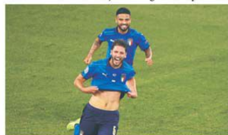
Manuel Locatelli este noul star al naționalei Italiei

dublă intervenție în fața lui Zuber și a păstrat avantajul de pe tabelă. Pe final Ciro Immobile (89) a marcat pentru 3-0 și are și el două goluri la această ediție. Italienii devin a doua echipă din istoria Campionatului European care începe competiția cu două victorii la diferență de trei goluri după Olanda