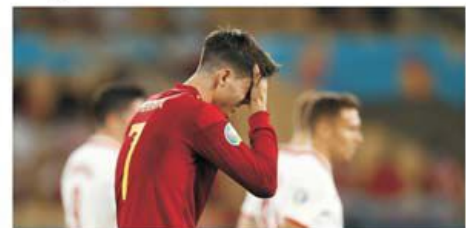
Disperarea ibericilor după al doilea egal

Spania continuă să dezamăgească la acest turneu final de EURO, nereușind în primele două partide să își apropie victoria. După ce a remizat fără goluri cu Suedia a venit rândul Poloniei să