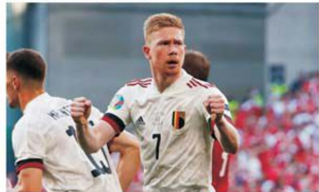
Magicianul Kevin de Bruyne a schimbat fața Belgiei și a adus victoria diavolilor roșii

Pentru danezi a rămas meciul de a fi sau nu a fi cu Rusia. Dacă bat și Finlanda nu profită de calificarea belgienilor atunci vor fi trei echipe cu trei puncte, dacă danezii bat pe ruși.