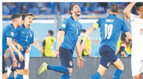
Italia a învins Elveția și e prima în optimi