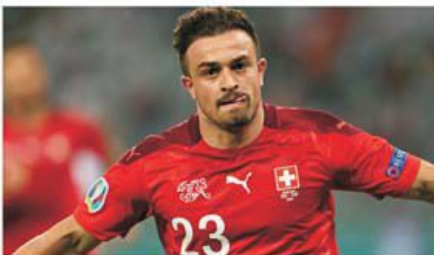
Xherdan Shaqiri a fost motorul elvețienilor, reușind și două goluri

Elveția a obținut în ultimul meci din cadrul grupei A prima victorie la turneul final al EURO 2020, trecând de Turcia cu scorul de 3-1 pe stadionul Olimpic din Baku. Cu patru puncte Elveția încheie grupa la egalitate cu Țara Galilor, dar are golaveraj inferior și astfel galezii ocupă locul secund, calificându-se direct în optimi în timp ce naționala din Țara Cantoneilor trebuie să aștepte jocul rezultatelor pentru a vedea dacă