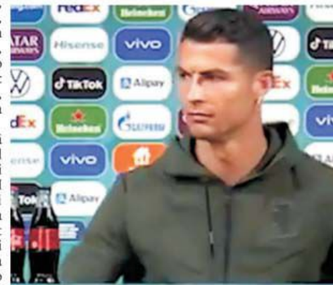
Cristiano Ronaldo a sărit calul în conferința de presă de la Budapesta măturând la propriu cu unul dintre marii sponsori de la EURO 2020

Drept urmare a măturat cu brațul sticlele de Coca Cola din fața lui și a scos o sticlă de apă îndemnând la consumul acesteia. Pe loc acțiunile Coca Cola au scăzut și în câteva ore producătorul de băuturi răcoritoare a pierdut 4 miliarde de dolari! Ce bea acasă Ronaldo e problema lui, însă nu poți mătura un sponsor din fața ta. Mai ales că în urmă cu niște ani, pe când juca la Manchester United, a luat bani frumoși dintr-un clip publicitar pentru dușmanul de azi. E