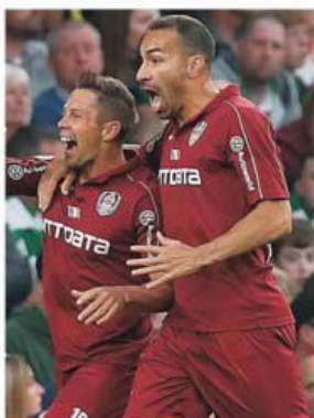
CFR Cluj a fost singura echipă din România care a contat în Europa în ultimii ani

fie, pe în vîngătoarea dublei dintre Fola Esch și Lincoln. Adică echipa mai bună dintre campioanele Luxemburgului și Gibraltarului, adversari cu cel puțin două nivele mai jos decât gruparea din Gruia. Asta pentru că până în turul 3 preliminar CFR a fost protejată de poziția de cap de serie. De acolo mai departe însă protecția se ridică și pot apărea numele grele, dar deja nu ar mai fi o problemă. Pentru că și dacă ar ieși în turul 3 Clujul nu ar fi out din Europa. Doar s-ar muta în play-off-ul de Europa League. Dacă ar face pași greșii încă din turul 1 sau 2 preliminar campioana României nici așa nu ar fi eliminată, fiind trimisă să continue în noua înființată Conference League. Aceasta ar fi însă varianta horror și pentru