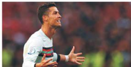
Cu două goluri marcate, Cristiano Ronaldo și-a depus candidatura la titlul de golgeter al turneului

Meciul de pe arena Ferenc Puskas s-a jucat cu un stadion arhiplin, cu suporteri care au stat unul lângă altul, fără măști, ca în vremurile de dinainte de pandemie. Cristiano Ronaldo și coechipierii săi au dominat prima repriză, dar nu au reușit să găsească un punct vulnerabil în poarta apărată de Peter Gulacsi. Chiar Ronaldo a ratat cea mai mare ocazie a reprizei, trimițând peste poartă din 7-8 metri, singur cu portarul. În a doua repriză, maghiarii au prins curaj și s-au apropiat și ei mai des de poarta portugheză. În minutul 80, gazdele și-au ridicat în picioare suporterii. Schon a marcat, dar reușita a fost anulată pe motiv de ofsaid. Portugalia a deschis în cele din urmă scorul, în minutul 84, cu un gol