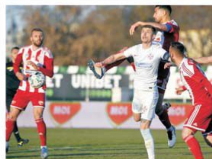
Sepsi Sfântu Gheorghe debutează în cupele europene, întâlnind în turul 2 preliminar al Conference League pe Spartak Trnava sau pe Mosta din Malta

mai fi tolerată și sancțiunile vor fi dure. Craiova va juca împotriva învingătoarei dintre Laci din Albania și FK Podgorica, cel mai titrat club din Muntenegru, cu cinci titluri în CV. Debutantă la noi este Sepsi Sfântu Gheorghe, care deși nu a fost cap de serie ca FCSB sau Craiova a avut noroc, putând elimina fie pe Spartak Trnava, fie pe Mosta din Malta, care se vor confrunta între ele în primul tur. Așadar, Fortuna a decis să acorde șanse nu doar CFR-ului, ci și celorlalte ambasadoare ale fotbalului românesc. Rămâne doar de văzut dacă și cum vor ști să le valorifice.