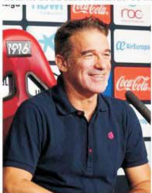
Antrenorul Luis Garcia, la a doua promovare în Primera după cea cu Levante din 2010

Reial Club Deportivo Mallorca, așa cum sună numele clubului în limba catalană, limbă oficială în Insulele Baleare alături de spaniolă, va începe în august al 29-lea sezon în elita fotbalului din Spania, acolo unde ocupă locul 18 în ierarhia "all-time". A fost promovată pentru a noua oară, doar în două cazuri aflându-se în