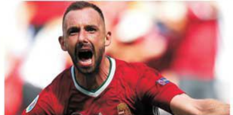
Fiola, simbolul unei Ungarii care a refuzat să se predea

Cu un minut înaintea startului meciului de la Budapesta probabil că un procent extrem de redus de iubitori ai fotbalului ar fi pus la îndoială victoria campioanei mondiale în fața Ungariei. Argumentele erau simple și clare: dincolo de indiscutabilul decalaj de valoare al loturilor debutul la EURO 2020 fusese diametral opus. Ungaria rezistase eroic timp de 80 de minute în fața campioanei europene în exercițiu, Portugalia, dar apoi a încasat trei croșeuri de KO. Franța venea după o excelentă negociere a ceea ce părea a fi cel mai dificil meci, pe terenul Germaniei, victorie prin autogolul lui Hummels. Așa arătau datele