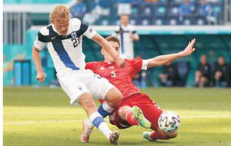
Duelurile dintre jucătorii celor două echipe au fost deseori la limita regulamentului