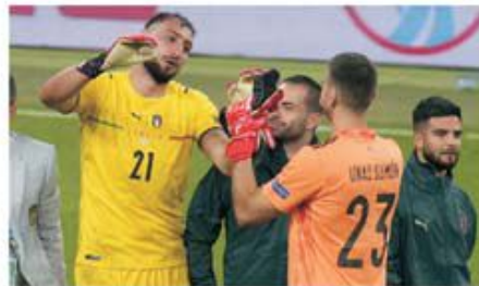
Gigi Donnarumma și Unai Simon au făcut tot ce au putut pentru echipele lor naționale, dar la final doar italianul a plâns de fericire

Italia merge în finala EURO 2020 după o semifinală decisivă la lovituri de departajare în fața Spaniei. Ibericii au fost echipa mai bună, au desnat mai frumos atât în primele 90 de minute cât și în prelungiri, dar Italia lui Roberto Mancini e o națională foarte bine pusă la punct și cu cei doi Highlanderi din centrul apărării, Chiellini și Bonucci, împreună însumând 80 de ani, poate suporta lejer dominarea oricărui adversar, pentru a lovi mortal pe contraatac. Azzurrii își iau astfel și