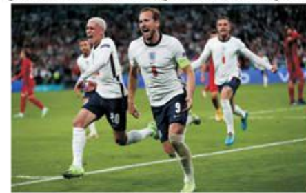
Harry Kane e cel care a calificat Anglia după 55 de ani într-o nouă finală

cetățeanul Kane a marcat golul calificării la a doua încercare, după ce Schmeichel i-a ghicit colțul, dar a respins în față. Anglia a