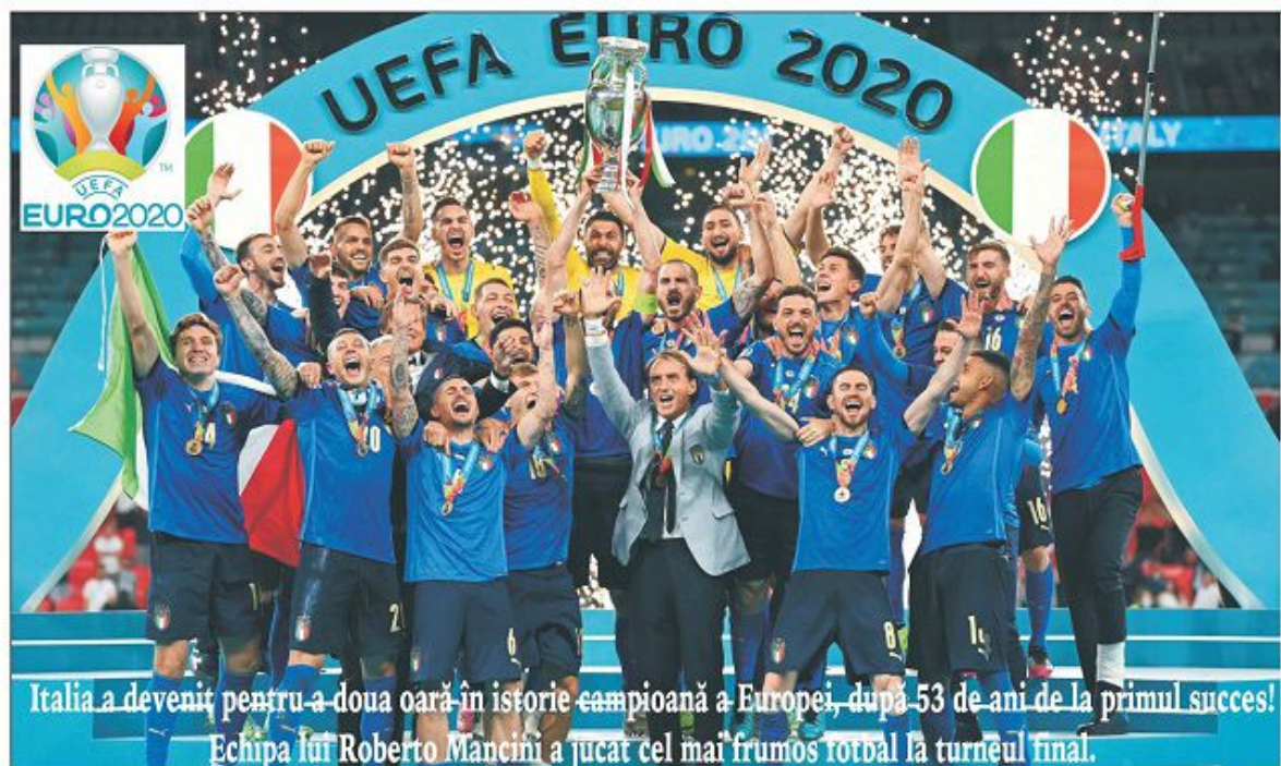
Italia a devenit pentru a doua oară în istorie campioană a Europei, după 53 de ani de la primul succes! Echipa lui Roberto Mancini a jucat cel mai frumos fotbal la turneul final.

• Publicație săptămânală editată de C.N. "Loteria Română" S.A. • Fondată 1954 •