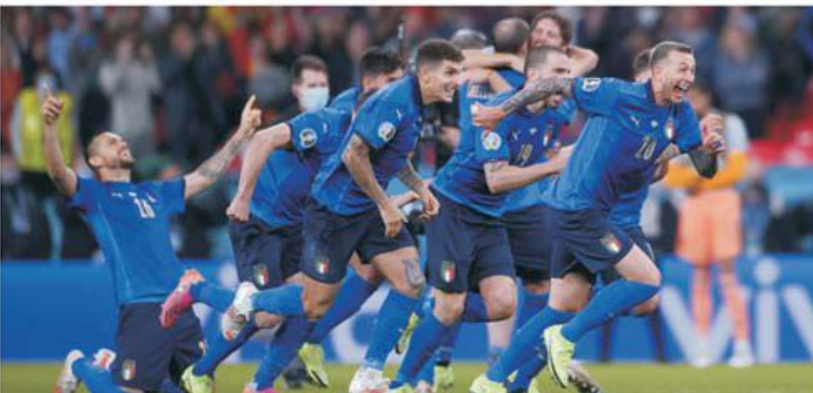
Azzurri au dat liber uriașei bucurii după ce au devenit campioni Europei

Lovituri ratate: Belotti, Jorginho / Rashford, Sancho, Saka