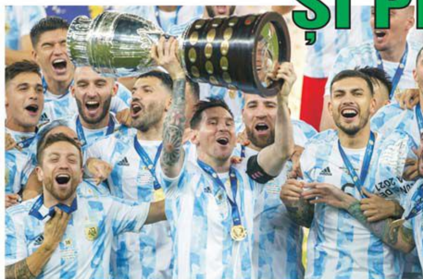
Lionel Messi și Argentina, campioni ai Copei America! La 33 de ani Messi obține, în sfârșit, primul trofeu cu echipa națională a țării sale după 1-0 în finală cu Brazilia

• Și primul concurs Prono-S cu meciuri din prima manșă a turului 1 în Conference League nu a avut parte de câștiguri la categoria I-a sau a II-a. Există un singur jucător care a prins 11 rezultate, categoria a 3-a, care a luat 798 RON. Astfel a crescut reportul pentru următorul concurs la 7171 pentru categoria I-a și 598 la categoria a II-a. Fondul total de câștiguri are valoarea de 8568,54 RON. (S.D.)