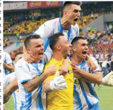
Bucuria oltenilor de la finalul loviturilor de departajare