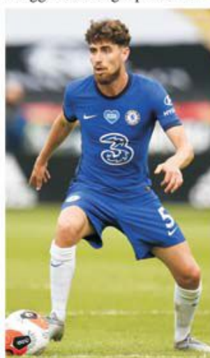
Italo-brazilianul Jorginho a fost desemnat de UEFA drept cel mai bun jucător al anului.

În altă ordine de idei, Jorginho (29 de ani), mijlociaș italian de origine braziliană al lui Chelsea, este jucătorul anului în viziunea UEFA! Jorginho a cucerit atât Liga Campionilor alături de Chelsea, cât și EURO 2020 alături de echipa națională a Italiei. Cel mai bun antrenor al anului a fost numit Thomas Tuchel (47 de ani), tehnicianul german care a cucerit Liga Campionilor alături de Chelsea.